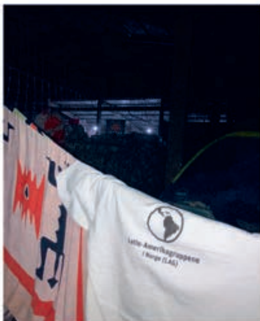
Vi slo leir i kooperativets hall.