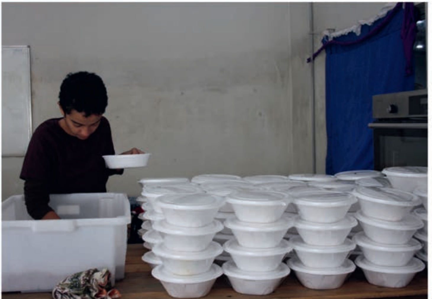
Varme matpakker med ris og bønner.