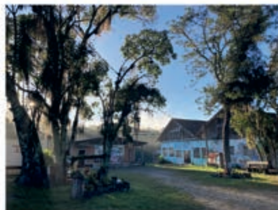
Skolen i morgengry

Skoledagen fylles videre med en blanding av undervisning og arbeid. Teorien tar for seg alt fra plantevitenskap og biologi til marxistisk tenkning og urfolksspråket guaraní, som i tillegg til å være offisielt språk i Paraguay og viktig minoritetsspråk i Brasil, snakkes av flere av klassens studenter. Studentene velger seg også