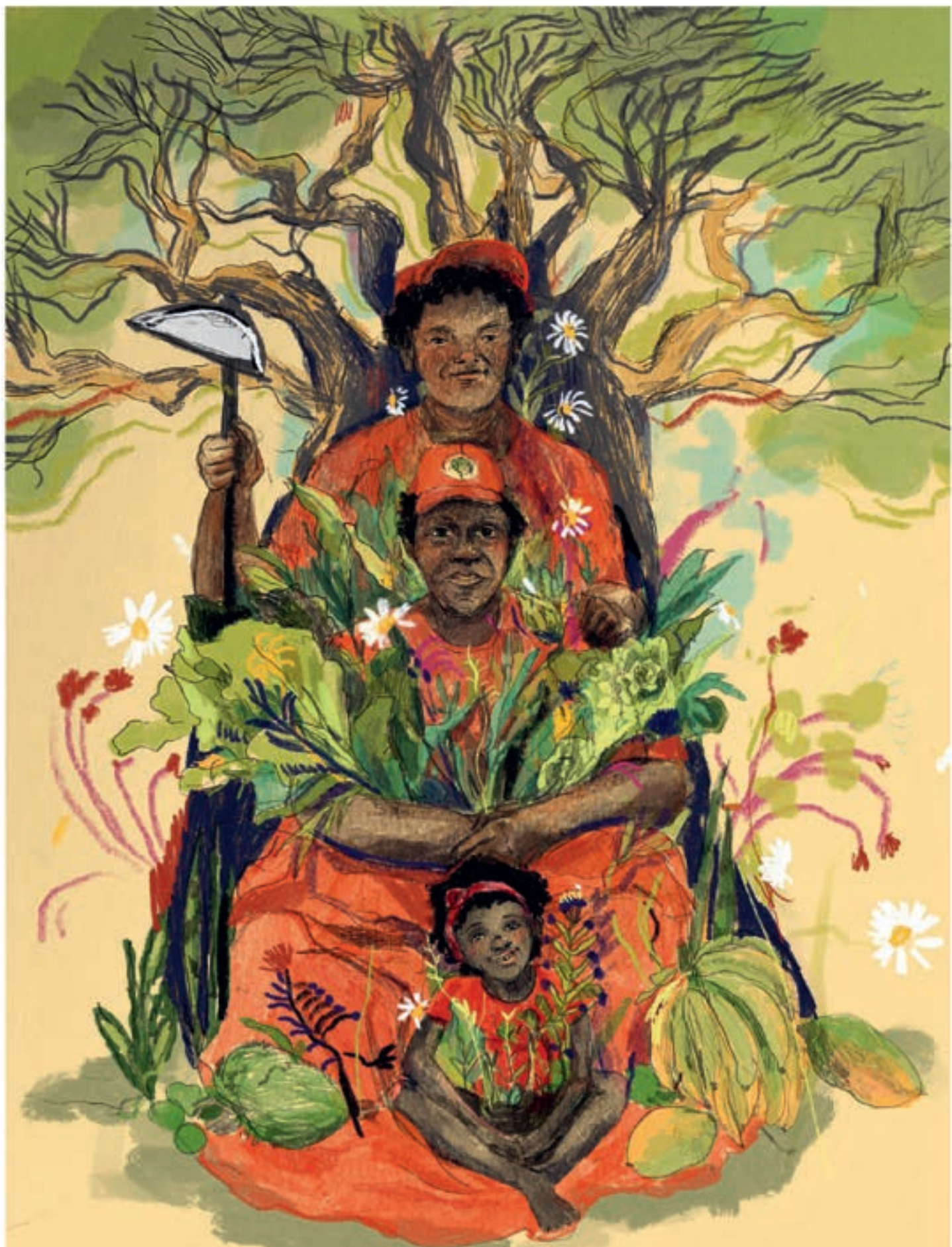
PARA COMPANHEIRA JÚLIA DO ACAMPAMENTO MARIELLE VIVE! VALINHOS -SP