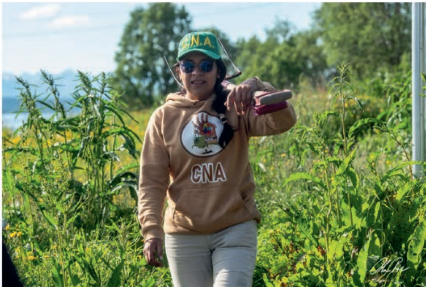
På Selnes gard i Troms, under eit av fleire gardsopphald.