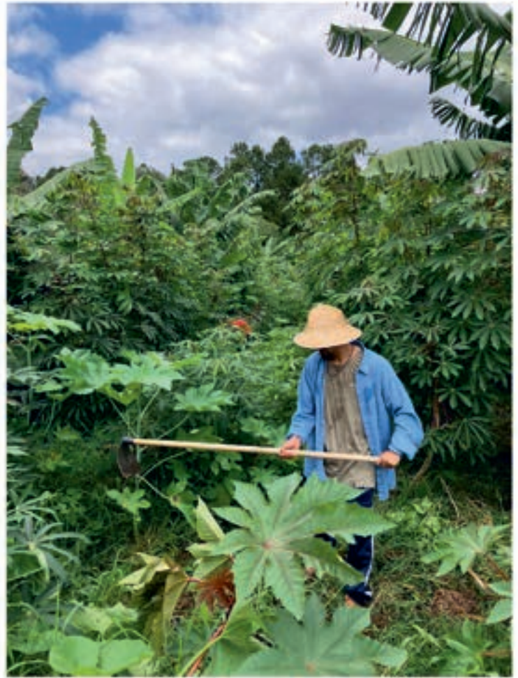
Studentene i arbeid i skolens matskog

et spesifikt emne å fordype seg i, som de skriver avhandling om mot slutten av studiet. Temaene er viktige elementer innen agroøkologien, blant annet matskog, husdyrhold, frø, økologiske innsatsmidler og frukttrær.