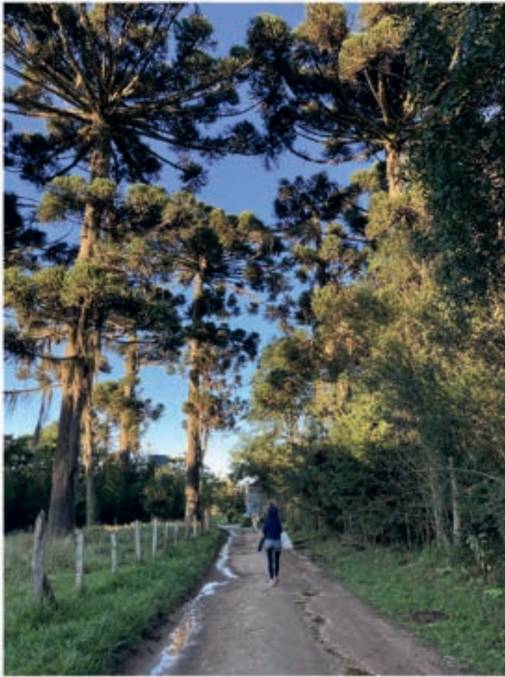
Veien til skolen under trærne