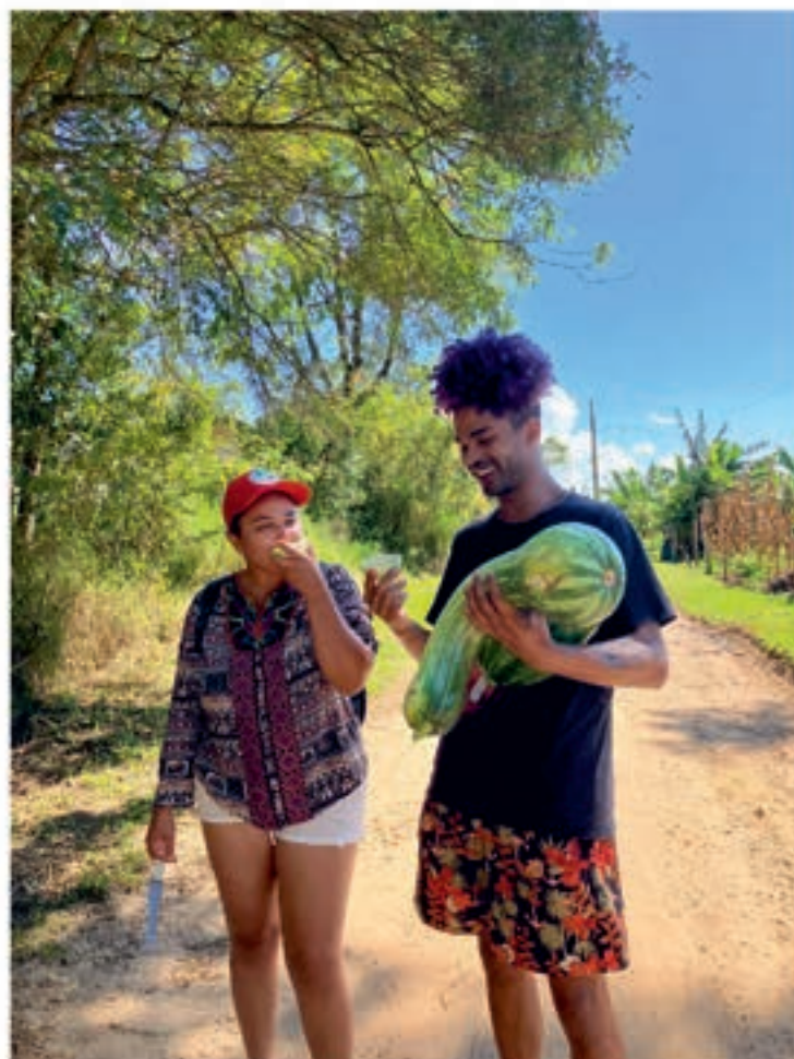
En del av arbeidet er også å høste inn til måltidene