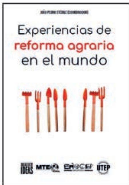
Bokomslag fra forlaget "Batalla de Ideas"