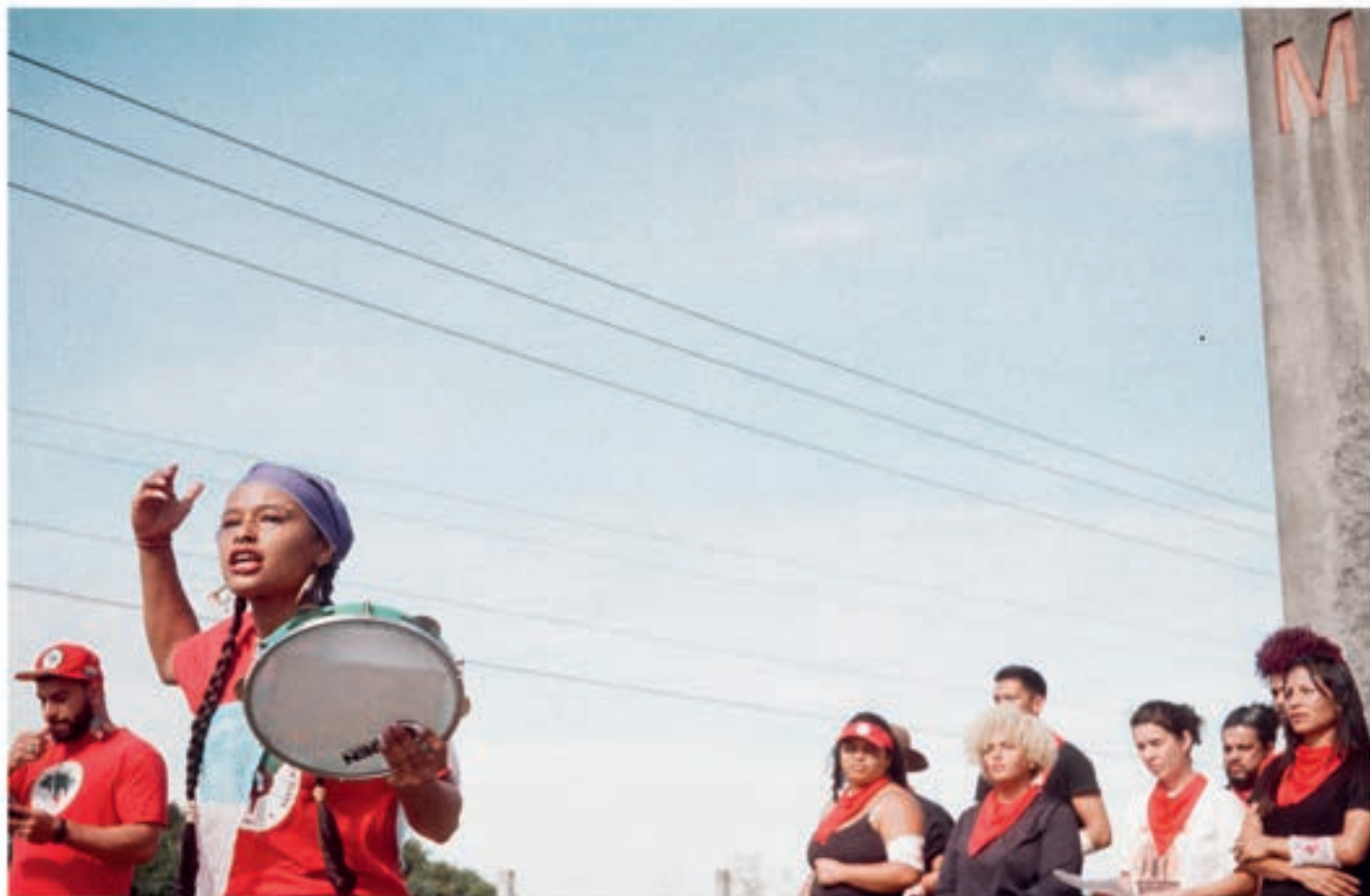
ELAA-studenter under en mistica

statsapparatet ikke klarer å møte befolkningens behov, i enda mindre grad enn ellers, blir arbeidet til grasrota og sosiale bevegelser desto viktigere. Mot slutten av august og starten av september i år var flere områder i Brasil rammet av tørke og skogbrann. Contestado-bosetningen var intet unntak. Ubuntu Aroeira-klassen, som nettopp hadde kommet tilbake til skolen for en ny periode med undervisning og arbeid, ble møtt av brennende skog, og ble sammen med de lokale sendt ut i delegasjoner til de berørte familiene for å hjelpe til med å slukke brannen.