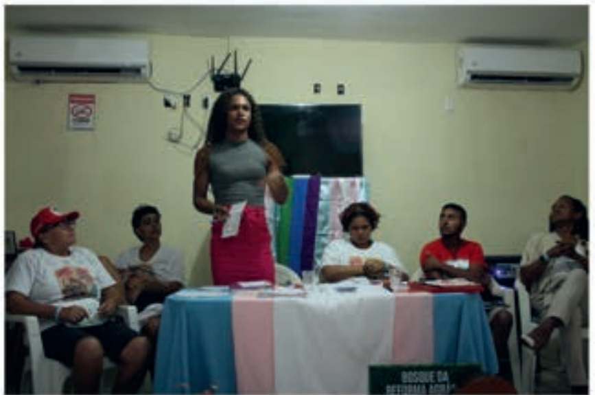
Møtet bestod av panelsamtaler og diskusjoner om transpersoners historie i Brasil, jusspørsmål, transhelse, transfobi på bygda og strategier for hvordan man kan bekjempe dette.