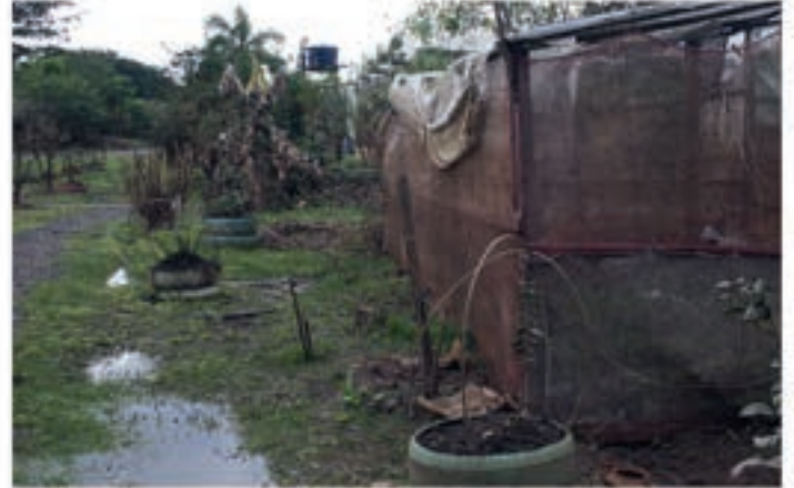
Alt så brunt og dødt ut der flommen hadde herjet. Det kommer til å ta lang tid å gjenoppbygge områdene.