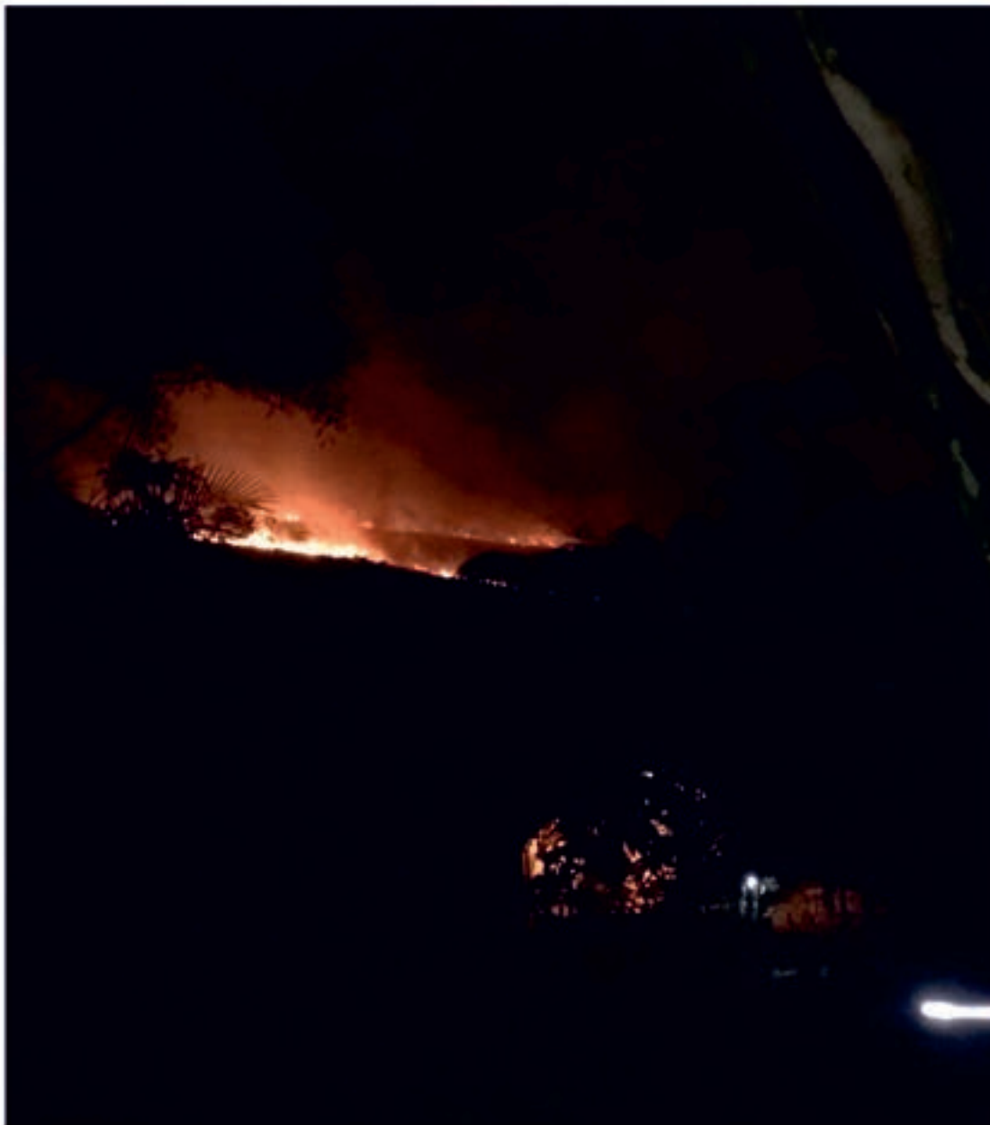
Skogbranner rammet Brasil i juli og august. Her sett fra skolen Frøya jobbet på i São Paulo

forbindelse med karbonkvoter, utvinning av mineraler til batteriproduksjon osv.