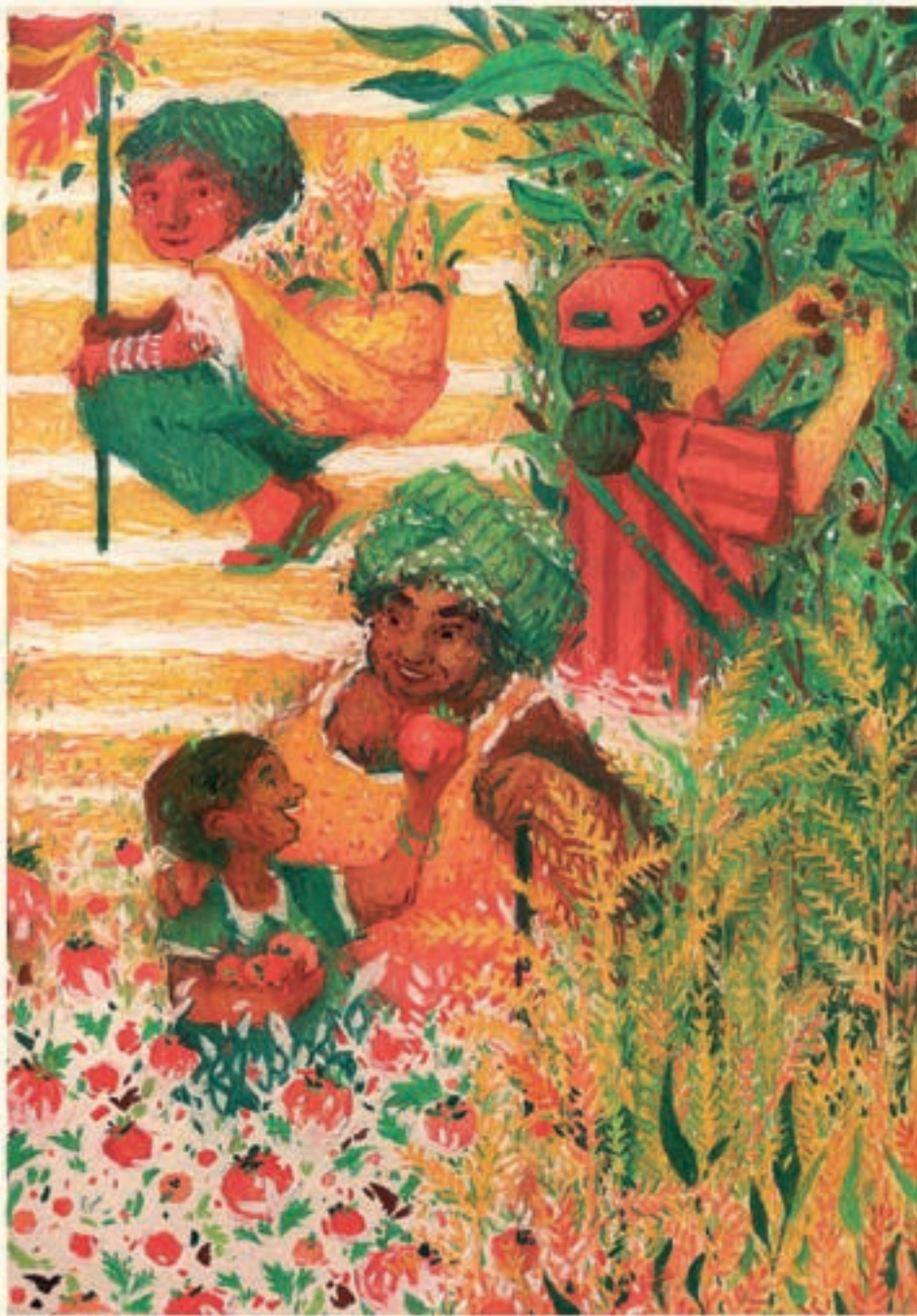
Illustrasjon: Duda Oliva

hegemoni, knuste deira stat, og tok på seg arbeidet med å bygge levande sosialistiske folkerepublikkar. Boka styrer unna ein kvar reduksjonistisk romanistisisme, og gjer oss grundige materialistiske analysar av komplekse prosessar. Her får vi sjå korleis romantisk revolusjonsoptimisme gradvis har måtte vike for meir pragmatiske tilnærmingar. I dag spelar småbruk og privateigendom på landsbygda i alle tre landa ei meir sentral rolle enn under tidlegare oppglodde epokar. Revolusjonære teoriar har møtt røynda, og dialektikken har dansa sin vals. Desse revolusjonære jordbrukseksperimenta gjev oss såleis bättevis av lærdommar.