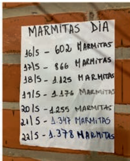
Oversikt over antall matpakker laget hver dag.

ikke kom i direkte kontakt med søle og søppel, anta at alt er kontaminert. Det er bare et tidsspørsmål før leptospirosesmitte og Hepatitt A blir et problem, og de sjukehusene som fortsatt fungerer er allerede overbelasta. Det er derfor ikke et alternativ for oss å bli sjuke. Vi vasker hendene og går i gang med å preppe grønnsaker til storkjøkkenet som er satt opp i Nova Santa Rita.