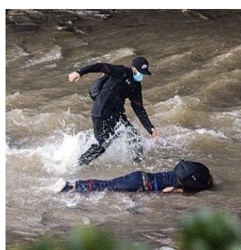
Andre demonstranter hjelper den bevisstløse demonstranten.